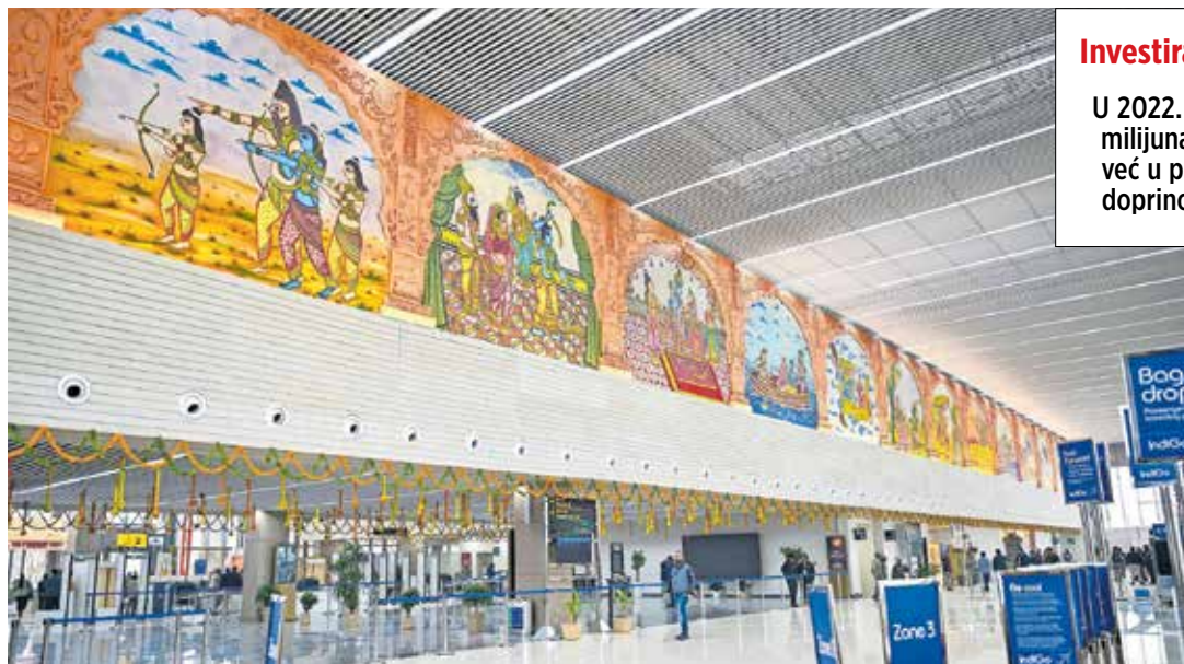
Nova međunarodna zračna luka Maharishi Valmiki otvorena 30. prosinca u Uttar Pradeshu savršeni je primjer uspješnog indijskog spajanja modernog s tradicionalnim

Uttar Pradesh, najmnogoljudnija indijska savezna država, brendirana je kao dom jedne od najljepših građevina na svijetu, Taj Mahala te Varanasiya, duhovne prijestolnice Indije pa ni ne čudi njena popularnost među turistima, koja je nakratko pala jedino tijekom pandemije Covida-19 i sveopćeg zatvaranja. Danas ova država ponovno bilježi rekorde u turističkoj posjećenosti. U 2022. posjetilo ju je impresivnih 318.5 milijuna turista, a taj je broj oboren već u prvih devet mjeseci 2023. godine. Osim atraktivne turističke ponude, stručnjaci kažu da iza sto-